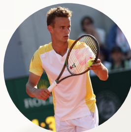
Luca Van Assche